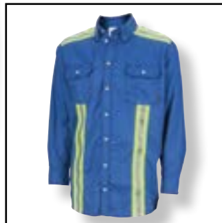
Nuestra de Cinta Reflectiva.