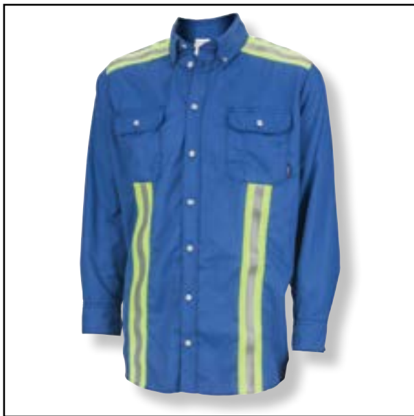
Nuestra de Cinta Reflectiva.